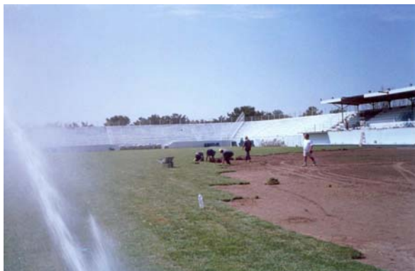
Εικ. 3-2. Διάστρωση έτοιμου χλοοτάπητα.

νήματα τοποθετούνται από εξειδικευμένο μηχανολογικό εξοπλισμό, έτσι ώστε να φθάνουν σε βάθος τα 20 cm ενώ ένα τμήμα 2 cm παραμένει πάνω από την επιφάνεια του εδαφικού υποστρώματος.