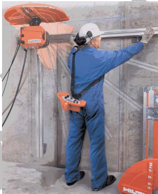
Σχήμα 2: Κοπή τοίχου με δισκοπρίοιο επί τροχιών καθοδήγησης