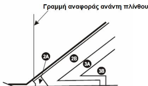
Σχήμα 2 - Λεπτομέρεια διάταξης ζωνών στον πόδα ανάντη λιθόρριπτου φράγματος με ανάντη πλάκα σκυροδέματος