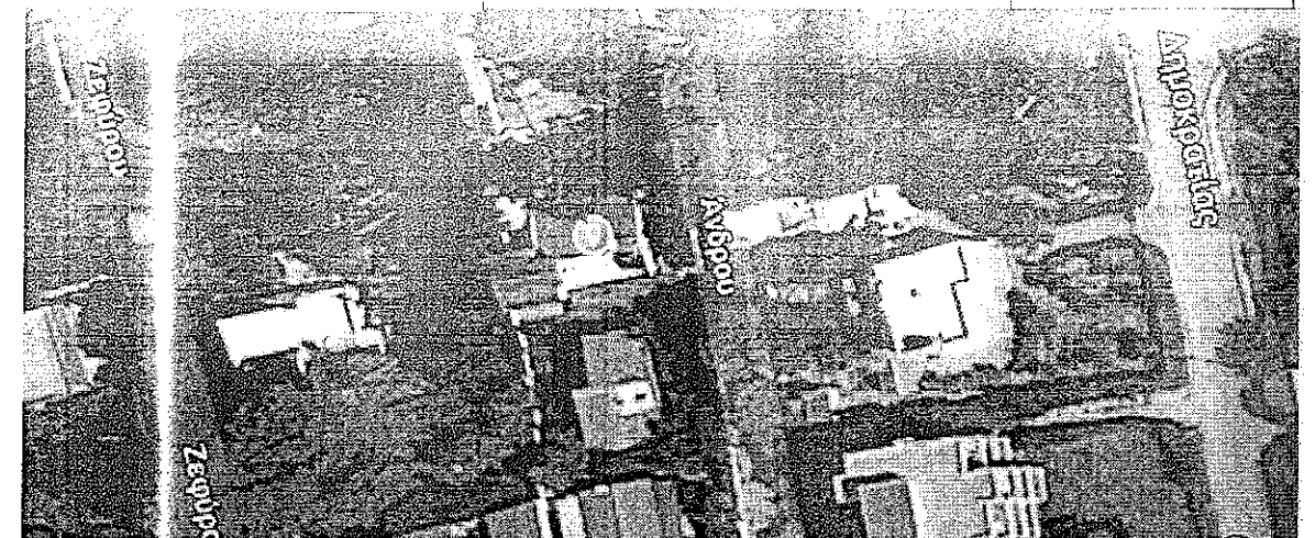
Το κτήριο πριν την πυρκαγιά

Όγκος υπογείου μετά το σεισμό = 26,32 \times 2,90 = 76,33 \mu^3