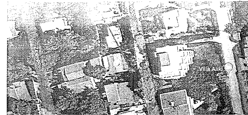
Άποψη κτιρίου προ πυρκαγιάς

Όγκος ορόφου = 36,98 \times (2,90 + 4,60) / 2 = 138,68 \mu^3